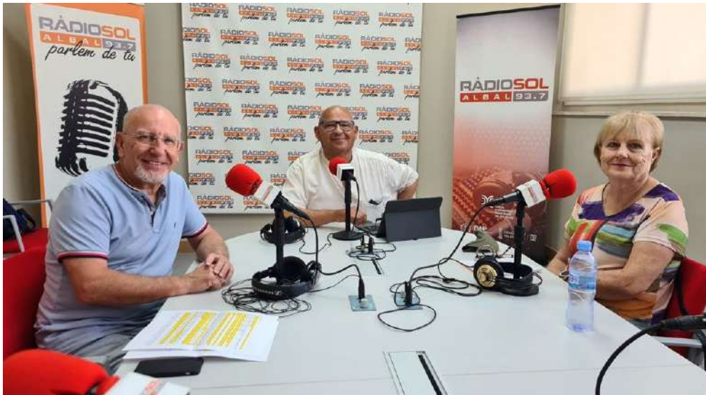
Foto: Programa de radio “La Veu dels Grans” en Radio Sol Albal, dirigida por los alumnos.