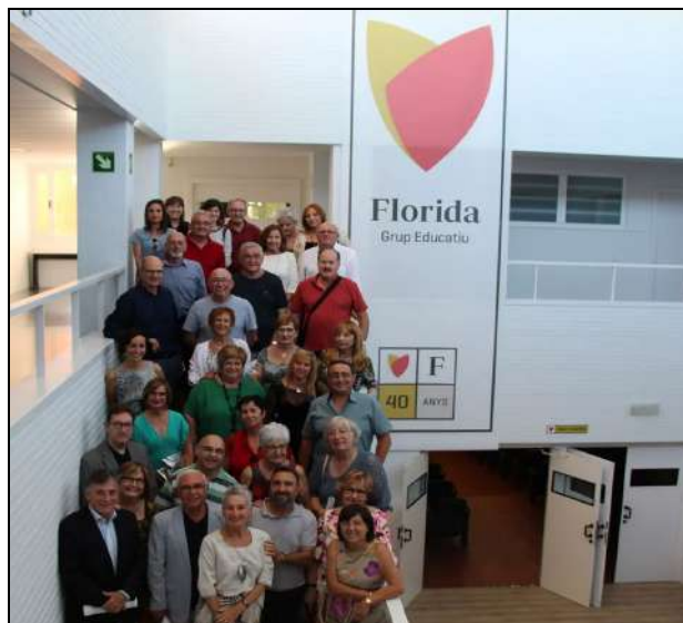
Foto: Grupo de estudiantes

El modelo educativo que queremos compartir, el de la Universitat dels Majors de Florida Universitaria, viene avalado por el análisis de los resultados de un proyecto vivo que ha ido creciendo y cambiando a lo largo de más de veinte años. Y que nos ha permitido comprobar cómo un determinado tipo de formación, atenta no sólo al conocimiento, sino también al crecimiento personal, a la experiencia del aprendizaje grupal y a la integración, visibilización y empoderamiento de las personas mayores, contribuye a una vejez activa y puede convertirse a su vez en un activo económico.