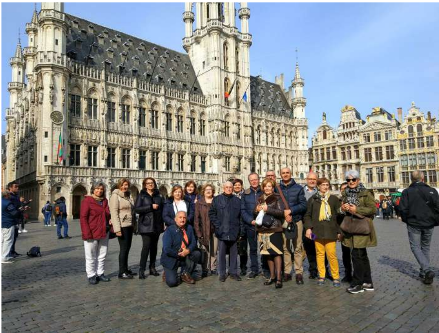
Foto: Visita a las Instituciones Europeas (Grand Place, Bruselas).

La realización del programa de radio “La Veu dels Grans” en Radio Sol de Albal, el Cine fórum, dirigido también por el alumnado. Tenemos escritores que presentan sus libros, artistas que muestran su obra en importantes exposiciones, y un nuevo proyecto que acabamos de poner en marcha: “La Escuela del Arte”.