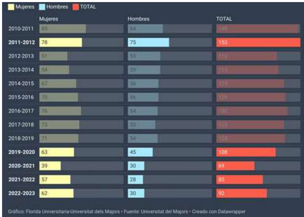
Cuadro 1.- Composición por sexos (periodo 2010-2023)

Pero hay un dato que nos enorgullece especialmente por lo que significa, y que nos ha permitido configurar uno de nuestros lemas: quien nos conoce, se queda. Y es que, en este momento, el grueso de nuestro alumnado está constituido por personas que hace ya años depositaron en nosotros su confianza, y después de graduarse tras los dos años requeridos para ello, decidieron permanecer en Florida Universitaria, cinco, diez y hasta quince años más. Esto nos permite acompañar durante todos estos años a estudiantes que comenzaron con 50, pues esa es nuestra edad de incorporación, y ofrecerles herramientas a través de la formación para enfrentar la vejez de forma activa e ilusionante.