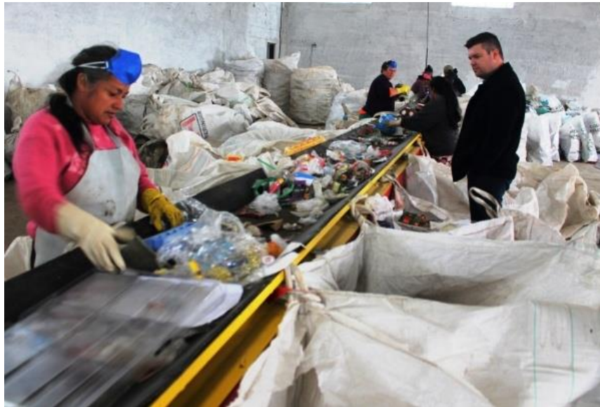
Figura 2- Galpão

Fonte: Site da Prefeitura de Restinga Sêca