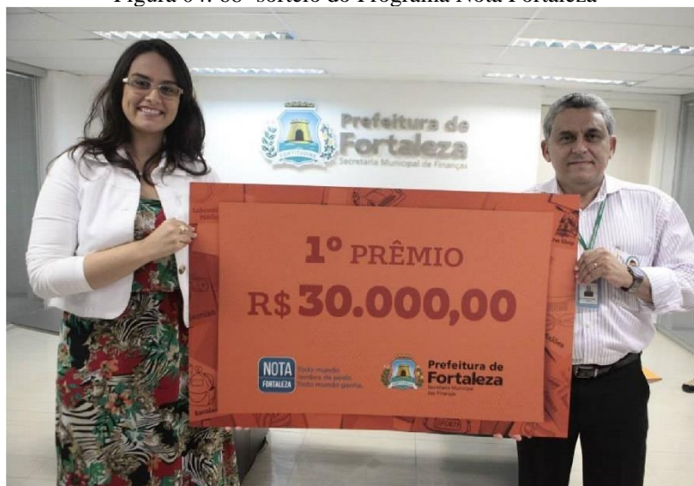
Figura 04: 68º sorteio do Programa Nota Fortaleza