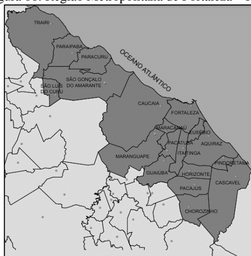
Figura 01: Região Metropolitana de Fortaleza – RMF

Atualmente, a RMF é composta por 19 municípios, conforme mapa exposto na Figura 01.