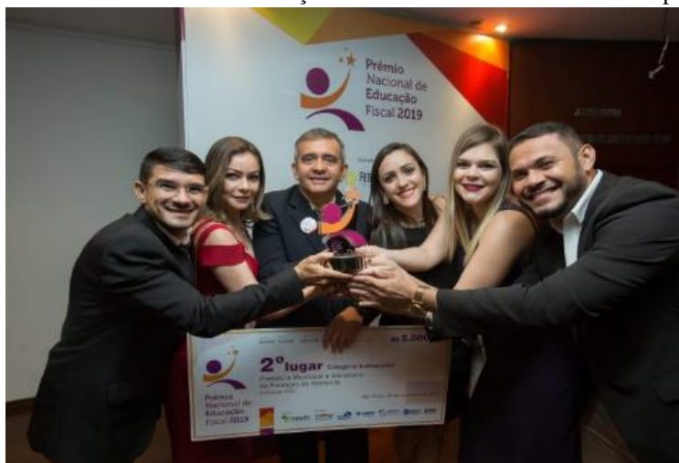
Figura 03: Prêmio Nacional de Educação Fiscal 2019 concedido ao Município de Horizonte