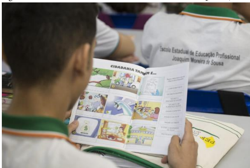
Figura 02: Escola Estadual de Ensino Profissional Eusébio de Queiroz, contemplada PEEF